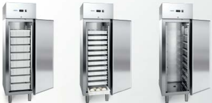
MOD. S PESCE