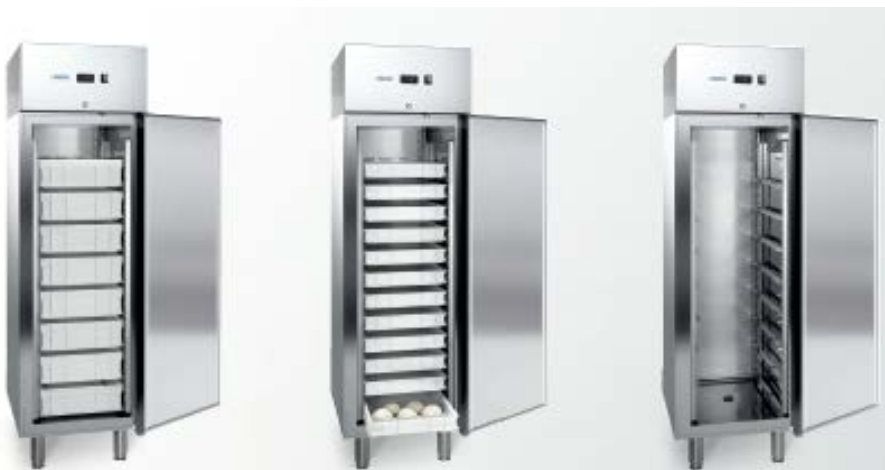
MOD. S PESCE